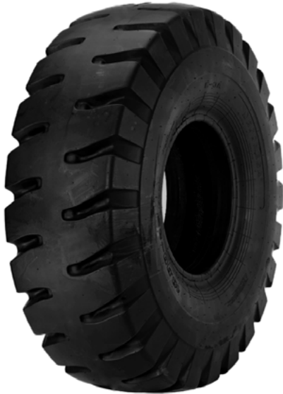
18.00-25 / 21.00-25 E3A IND.